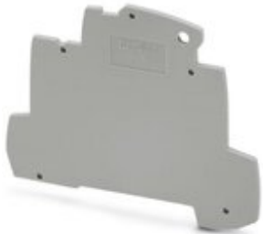
Enddeckel als Abschluss einer Klemmenreihe TERMITRAB complete TTC-6...

Bitte beachten Sie, dass die hier angegebenen Daten dem Online-Katalog entnommen sind. Die vollständigen Informationen und Daten entnehmen Sie bitte der Anwenderdokumentation. Es gelten die Allgemeinen Nutzungsbedingungen für Internet-Downloads. ( http://phoenixcontact.de/download )