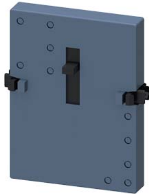
Mechanische Verriegelung für Schützkombinationen, für Schütze 3RT203, 3RT204