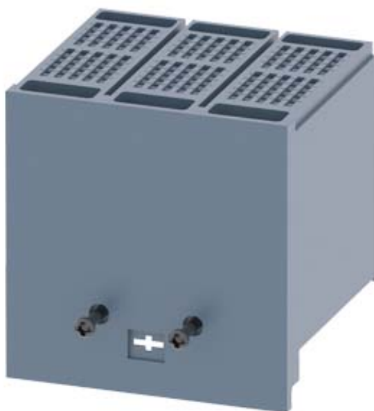
KLEMMENABDECKUNG VERLAENGERT 3 POLIG 1 ST. ZUBEHOER FUER: 3VA1 100/160