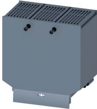
Klemmenabdeckung verbreitert 3-polig 1 Stück Zubehör für: 3VA10/11