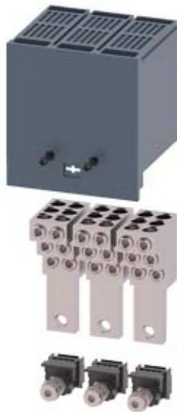
RUNDLEITERANSCHLUSSKLEMME 6 LEITUNGEN 3 ST. ZUBEHOER FUER: 3VA1 100/160