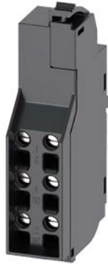
Hilfsschalter Wechslerkontakte Typ HP (14mm) Zubehör für: 3VA1 und 3VA20 bis 3VA25