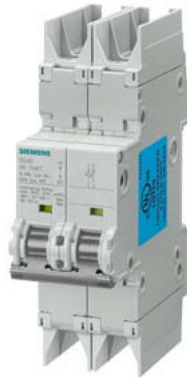
Leitungsschutzschalter 10kA, 2-polig, C, 4A nach UL 489-480Y/277V