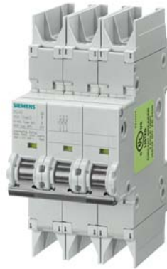
Leitungsschutzschalter 10kA, 3-polig, C, 6A nach UL 489-480Y/277V