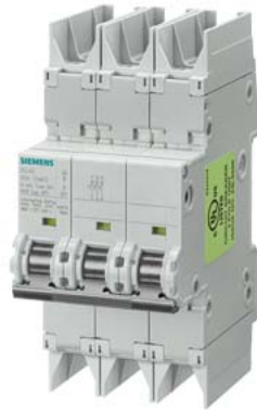
Leitungsschutzschalter 10kA, 3-polig, C, 10A nach UL 489-480Y/277V