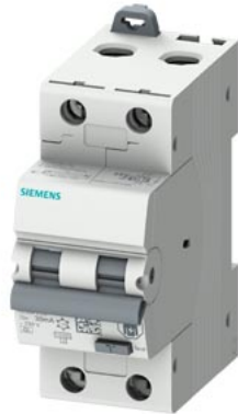
FI/LS-Schalter, 10 kA, 2P Typ A, 30 mA, B-Char, In: 13A Un: 230V