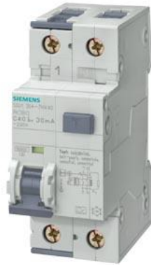
FI/LS-Schalter, 10 kA, 1P+N, Typ A, 30 mA, C-Char, In: 13 A, Un AC: 230 V