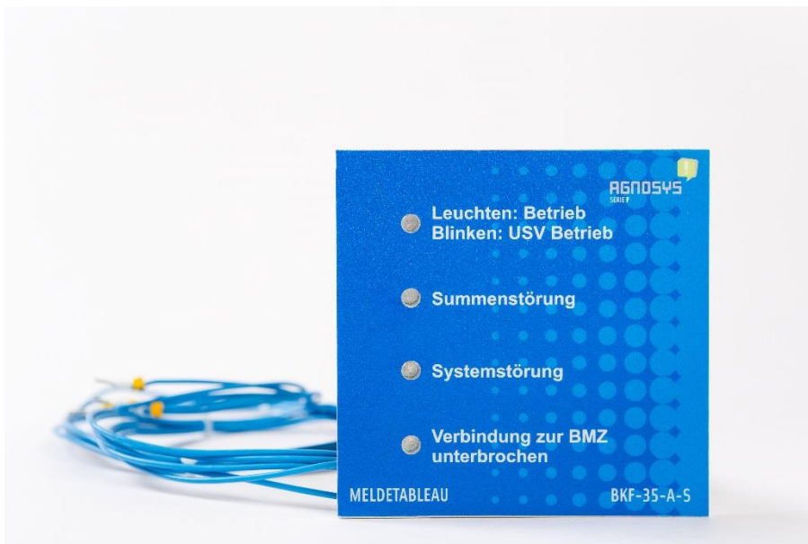
Abbildung 1: BKF-35-A-S, Meldetableau

Das Meldetableau, BKF-35-A-kann an allen DOs des Systems angeschlossen werden. Es wird direkt an der Externen Steuerzentrale angebracht und visualisiert mittels LEDs folgende Systemstati: