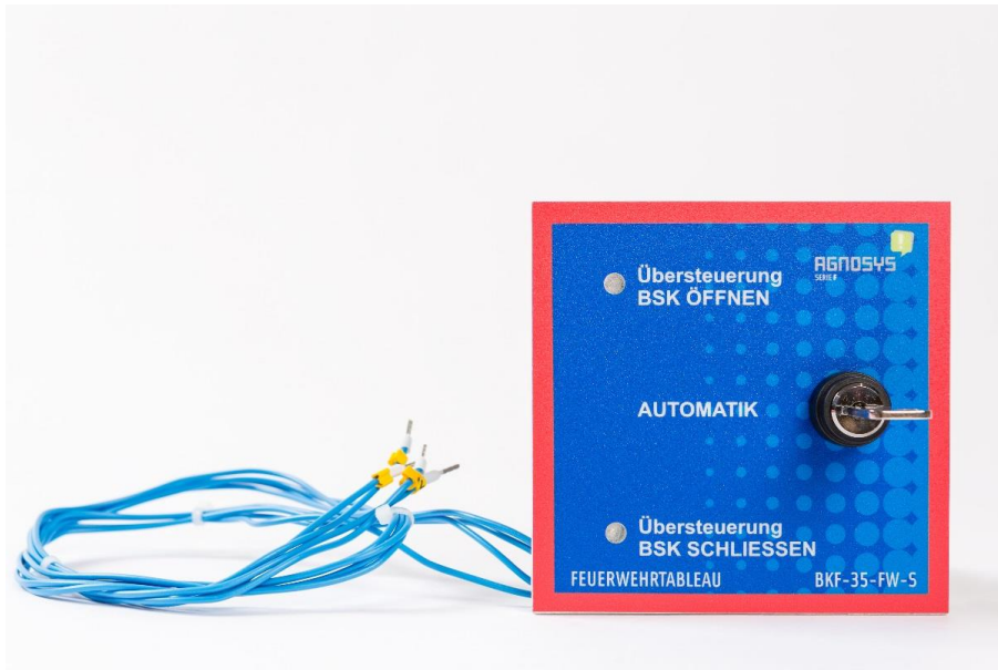
Abbildung 1: BKF-35-FW-S, Feuerwehr Schlüsselschalter

Der Feuerwehr Schlüsselschalter, BKF-35-FW-S kann an allen freien digitalen Eingängen des Systems angeschlossen werden. Er bietet die Möglichkeit sämtliche Brandschutzklappen eines AGF- Systems entweder zu schließen oder zu öffnen und abhängig davon die entsprechenden Lüftungsanlagen freizugeben. Er ist mit einem Schlüsselschalter ausgeführt, welcher vor unsachgemäßer Bedienung schützt. Es wird empfohlen den Schlüssel im Feuerwehrschrüsselkasten des Gebäudes zu deponieren.