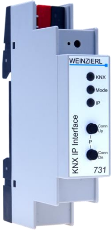
Foto des Geräts

Kompakte busversorgte Schnittstelle zwischen LAN/Ethernet und KNX-Bus